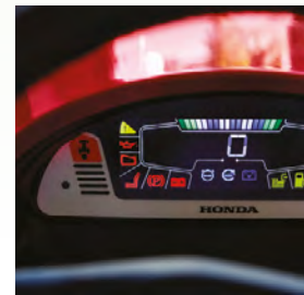
TABLEAU DE BORD LCD

Un levier permet de recueillir l'herbe coupée dans le bac de ramassage ou de la broyer finement pour créer un engrais naturel.