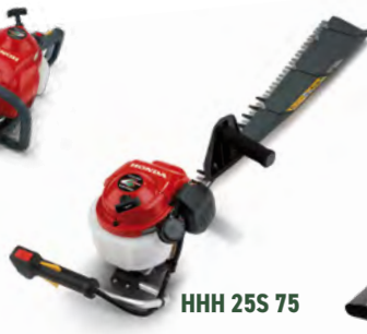
HHH 25S 75