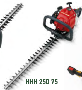
HHH 25D 75