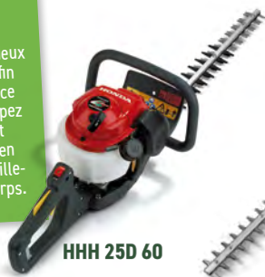
HHH 25D 60

Taillez vos haies deux fois par an, à la fin de leur croissance ou floraison. Coupez de bas en haut avec précision en maintenant le taille-haies près du corps.