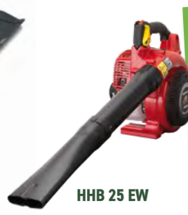
HHB 25 EW