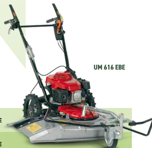
UM 616 EBE