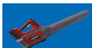
SOUFFLEUR - HHB 36 BXB