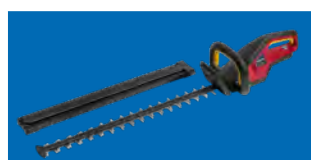
TAILLE-HAIES - HHH 36 BXB