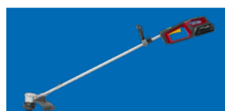
COUPE-BORDURES - HHT 36 BXB