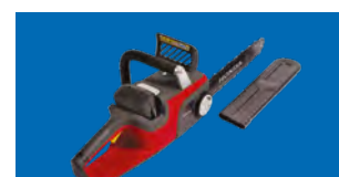
TRONÇONNEUSE - HHC 36 BXB