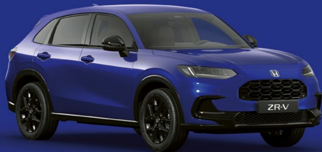
BLEU STILL NIGHT NACRÉ

Parmi une palette de couleurs contemporaines, sélectionnez la couleur qui reflète votre personnalité et le style dynamique du ZR-V.