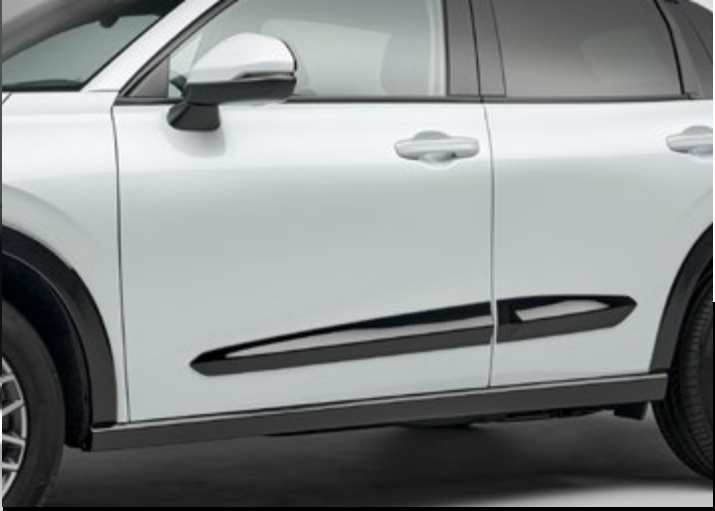
GARNITURES LATÉRALES DE CARROSSERIE Protégez votre véhicule des bosses lors du stationnement grâce aux garnitures latérales de carrosserie Berlina Black. Votre peinture est ainsi protégée tout en préservant les courbes fluides de votre ZR-V.