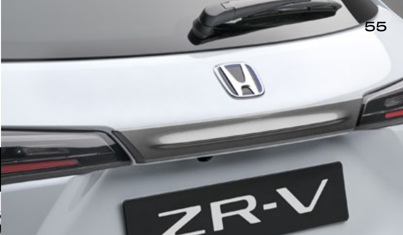
DÉCORATION DE SEUIL DE CHARGEMENT Améliorez l'aspect élégant et sophistiqué de votre voiture avec cette décoration de hayon attrayante.