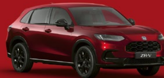
ROUGE RADIANT MÉTALLISÉ