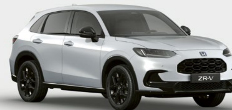
BLANC PLATINUM NACRÉ