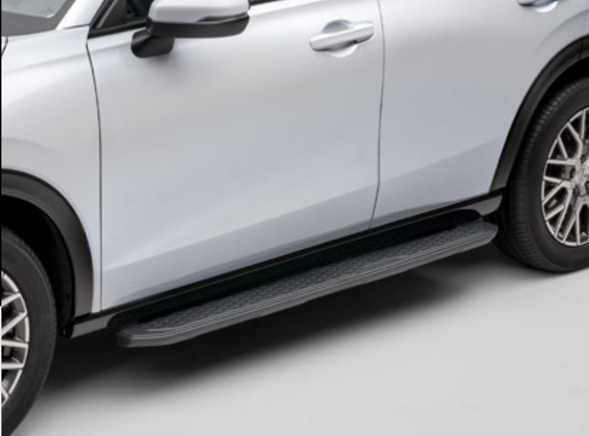
MARCHEPIEDS Nos authentiques marchepieds non seulement vous aident ainsi que vos passagers à entrer et sortir plus facilement du véhicule, mais ils confèrent aussi à votre ZR-V un look puissant et robuste.