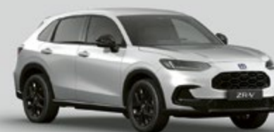
GRIS DIAMOND DUST NACRÉ