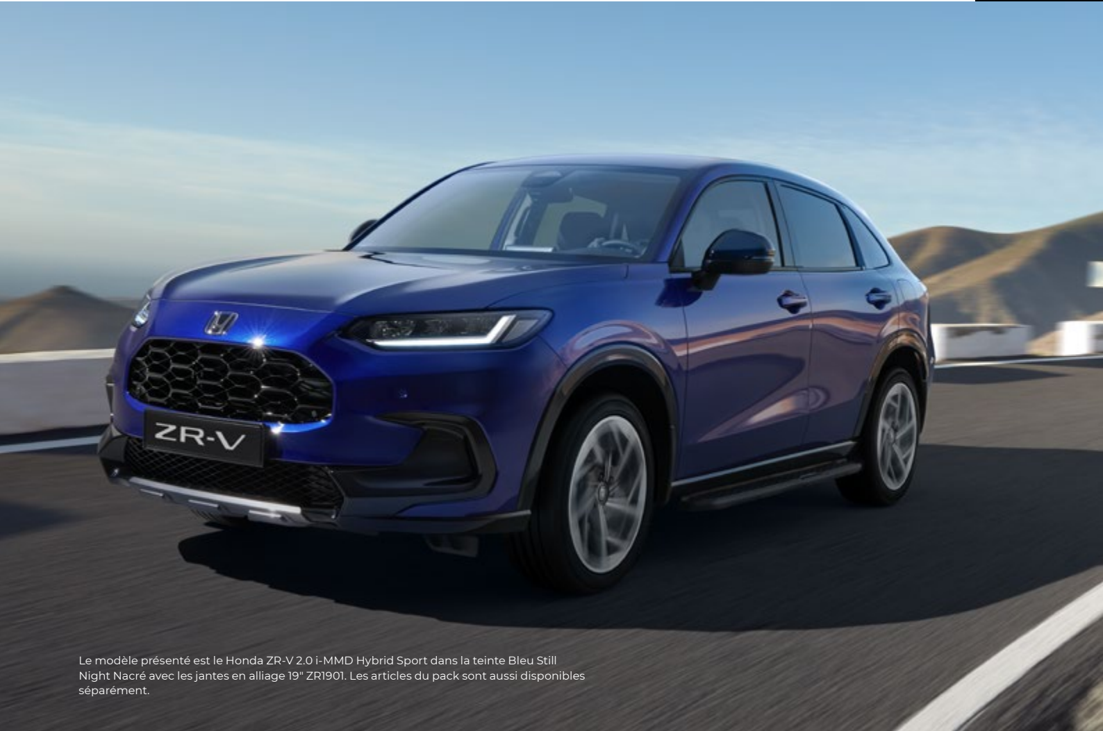
Le modèle présenté est le Honda ZR-V 2.0 i-MMD Hybrid Sport dans la teinte Bleu Still Night Nacré avec les jantes en alliage 19" ZR1901. Les articles du pack sont aussi disponibles séparément.

Sa désignation est éloquente, c'est le pack parfait pour les plus aventureux, ceux qui préfèrent emprunter les routes pittoresques. Le pack comprend une décoration basse avant et une décoration de seuil de chargement, tous deux dans la finition Gris Dusk Métallisé, ainsi que des marchepieds et des bavettes.