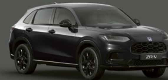
NOIR RUSE MÉTALLISÉ