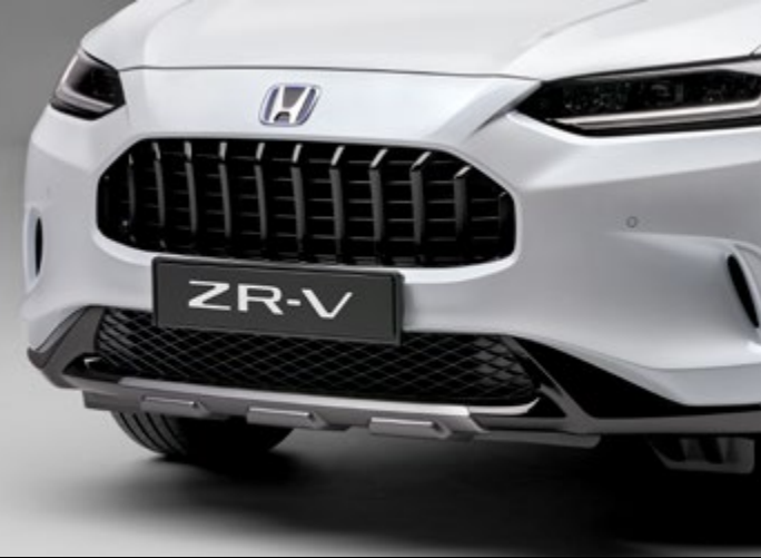
DÉCORATION INFÉRIEURE AVANT Confère à votre ZR-V un look plus robuste et distinctif. Parfait pour votre style de vie actif.