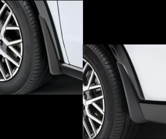
BAVETTES À L'AVANT ET À L'ARRIÈRE Pratiques et durables, ces bavettes subtiles protègent votre ZR-V contre les saletés et les pierres. Le kit comprend quatre pièces, pour l'avant et l'arrière de la voiture.