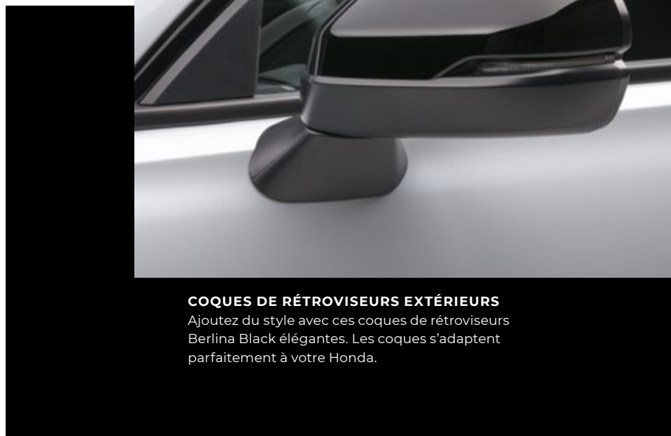
COQUES DE RÉTROVISEURS EXTÉRIEURS Ajoutez du style avec ces coques de rétroviseurs Berlina Black élégantes. Les coques s'adaptent parfaitement à votre Honda.