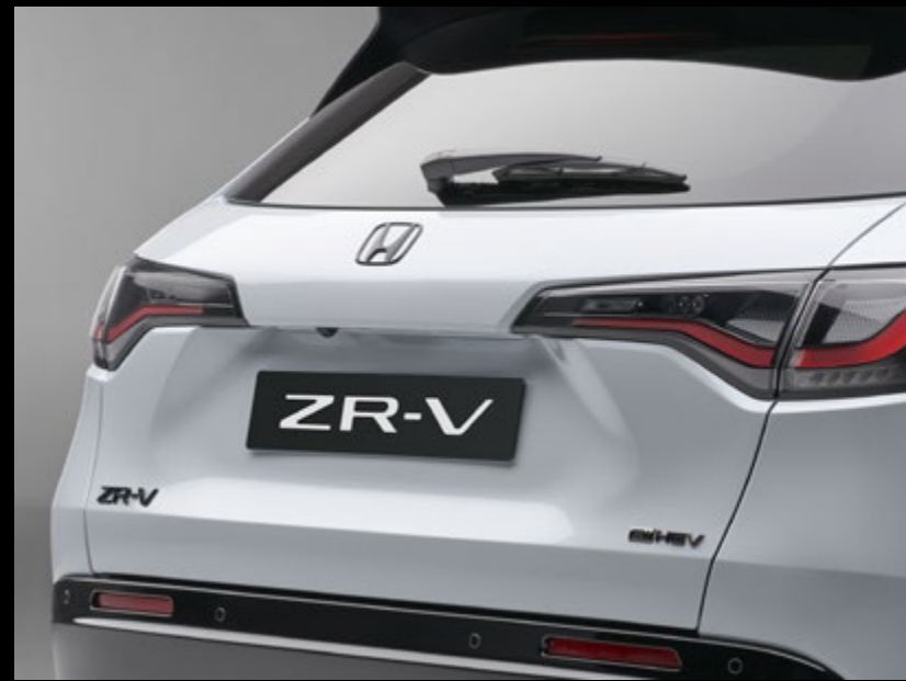
PACK D'EMBLÈMES NOIRS Tout est dans les plus infimes détails. Le pack d'emblèmes noirs rehausse harmonieusement le look de votre ZR-V. Ce pack comprend : des logos Honda noirs (avant et arrière), un badge noir au nom du modèle et un emblème e:HEV noir.