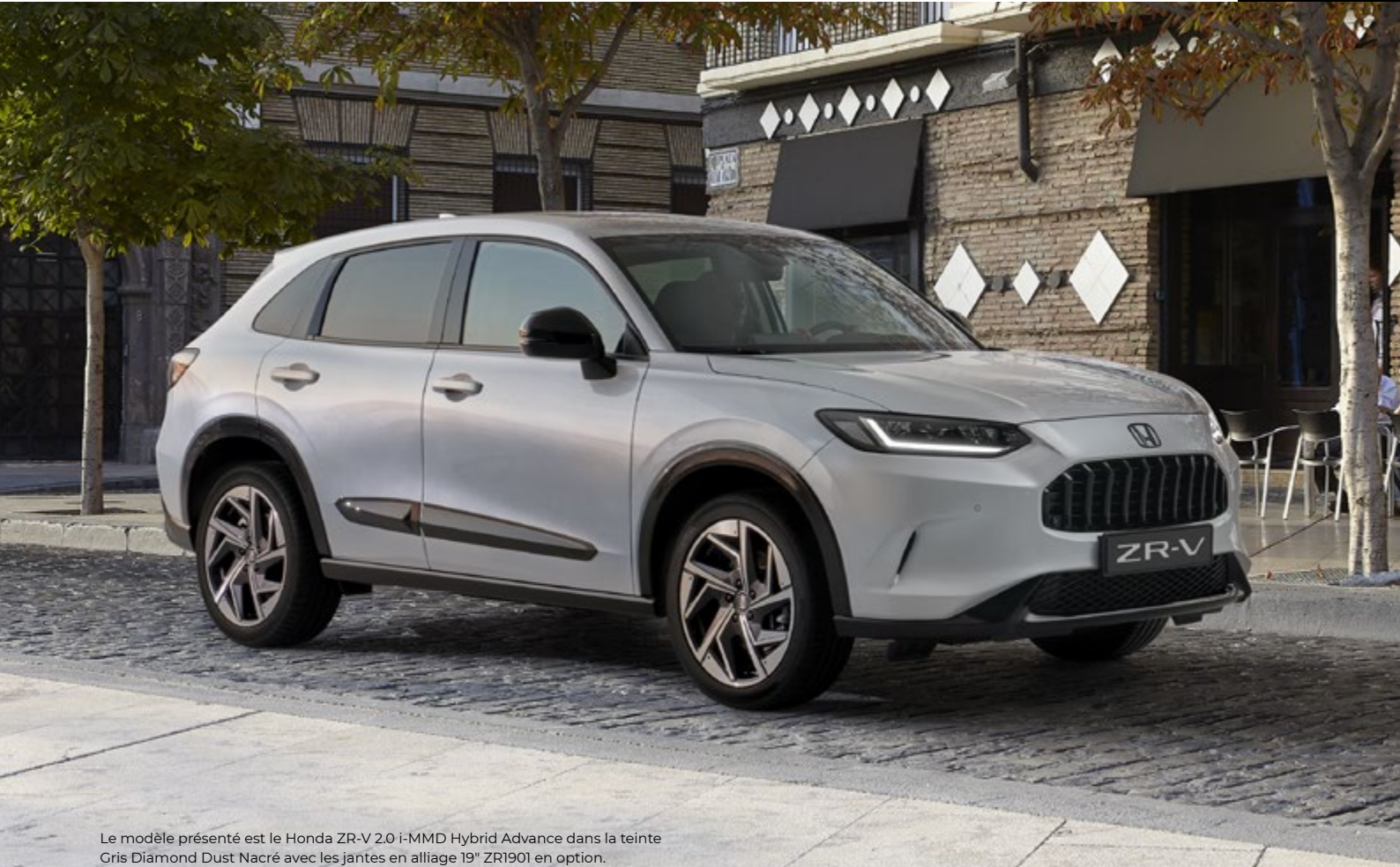
Le modèle présenté est le Honda ZR-V 2.0 i-MMD Hybrid Advance dans la teinte Gris Diamond Dust Nacré avec les jantes en alliage 19" ZR1901 en option. Les articles du pack sont aussi disponibles séparément.

Rendez votre voiture encore plus élégante grâce au pack Premium Black. Le pack inclut des coques de rétroviseurs extérieurs noires, des garnitures latérales de carrosserie noires et des emblèmes de couleur noire pour l'extérieur du véhicule.